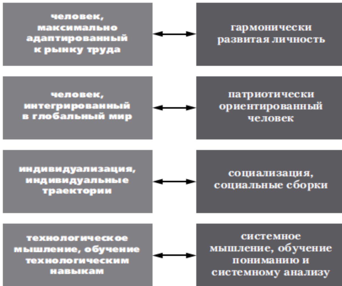
Рис. 1. Альтернативы выбора в педагогической теории