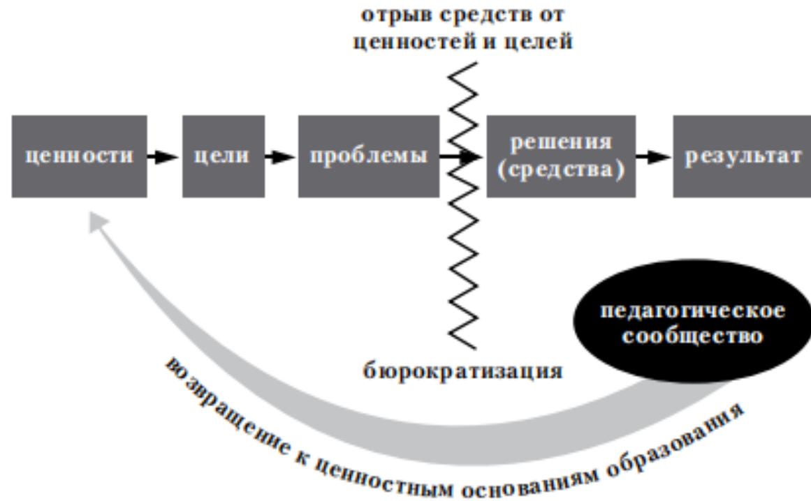
Рис. 13. Бюрократическая дисфункция образования