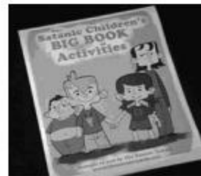
Школьникам США начали преподавать основы сатанизма. Пока факультативно