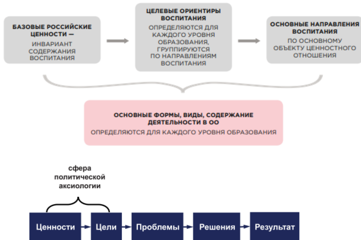
Рис. 1. Аксиология в системе государственной политики