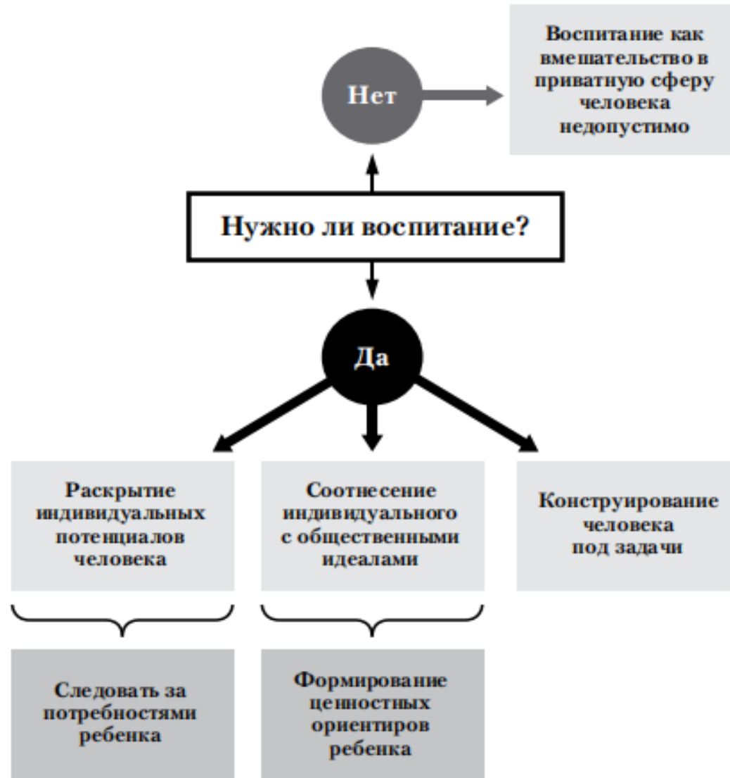
Рис. 10. Различные методологические подходы к воспитательной деятельности