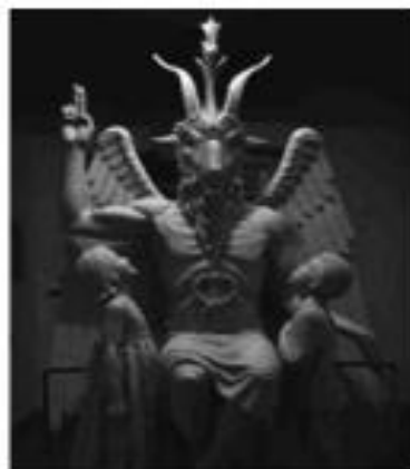
Статуя сатане, открытая в 2015 году в Детройте