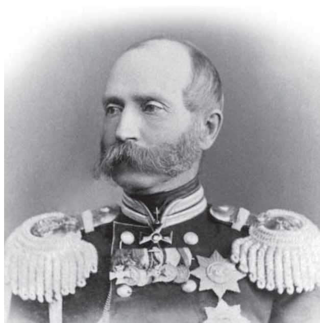
Ф. Ф. Трепов

Однако реализовать намеченный план в полной мере не удалось. Охранная стража Третьего от-