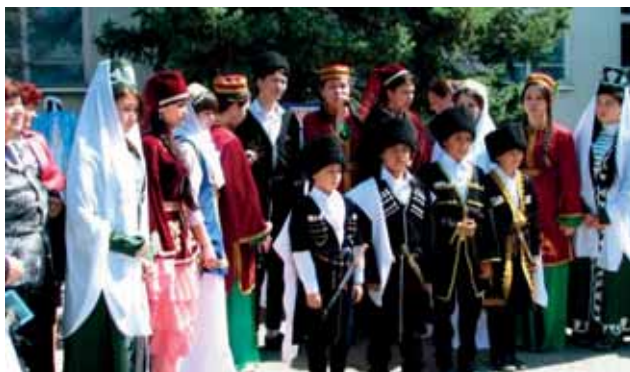
Фестиваль национального искусства «Мир на нефтекумской земле»