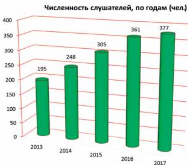
Численность подготовленных в ДВУЦТБ специалистов сил ОТБ

В целях технического обеспечения дистанционных образовательных технологий при обучении специалистов и студентов в области обеспечения транспортной безопасности оборудованы видеостудия ДВУЦТБ в головном вузе и специализированные классы в филиалах ДВГУПС (в городах Тынды, Южно-Сахалинск, Свободный, Уссурийск).