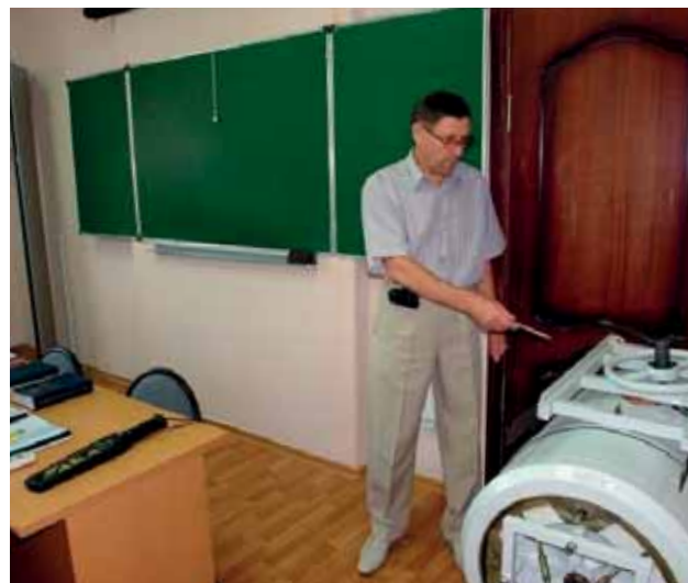
Лаборатория «Технические средства досмотра пассажиров, ручной клади и багажа»

требованиям. Учебный центр имеет необходимую материально-техническую базу, в состав которой входят специализированные лаборатории «Технические средства досмотра пассажиров, ручной клади и багажа» и «Инженерно-технические средства обеспечения транспортной безопасности».